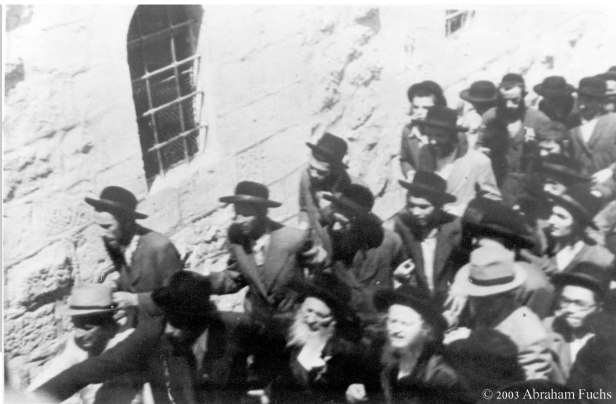
האדמו"ר לאחר קריעה בגדו ליד הכותל המערבי.